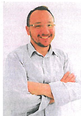
Ο δρ Κώστας Κωσταρέλος , καθηγητής στο πανεπιστήμιο του Μάντσεστερ, πρωτοπορεί στη νανοϊατρική.

«Η συσκευή αποτελείται από πολυμερή υλικά και έχει επιστρωση μετάλλου, ενώ μοιάζει με «μικροπρόβελα». Ο έλεγχός της γίνεται με ένα εξωτερικό μαγνητικό πεδίο, που την κάνει να περιστρέφεται και να κινείται προς τα εμπρός, ενώ μεταβάλλοντας το πεδίο αλλάζει και η κατεύθυνση της κίνησής της», επισημαίνει ο καθηγητής.